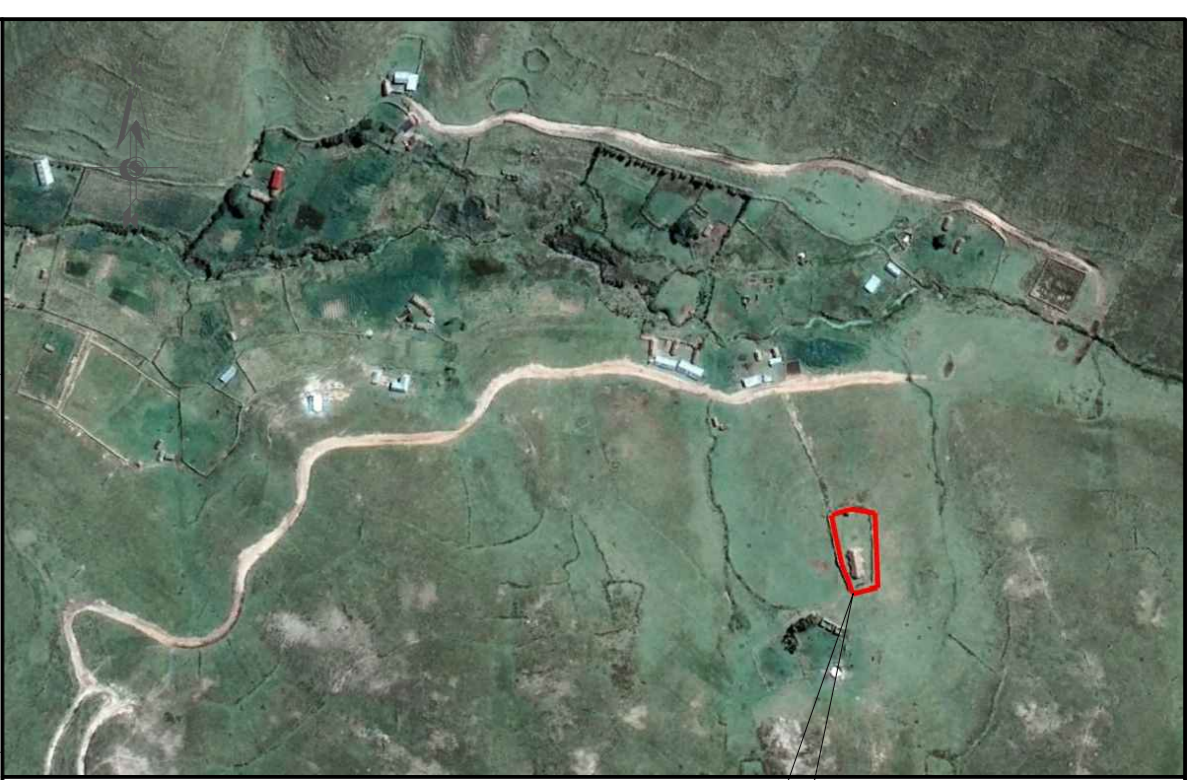
ESQUEMA DE LOCALIZACION ESCALA: S/E