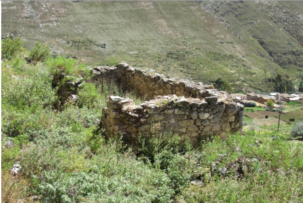
Foto N° 5. Vista de una estructura de planta rectangular que formaría parte del sector de colcas.