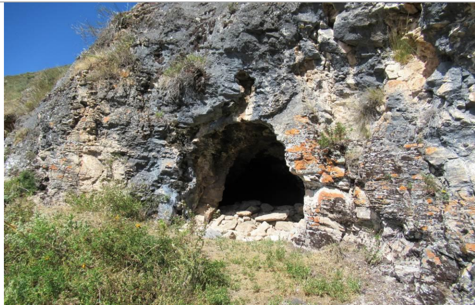
Foto N° 6. Vista de una cueva sobre la ladera del cerro, las cuales contienen en su interior entierros prehispánicos, y que actualmente se encuentran saqueadas