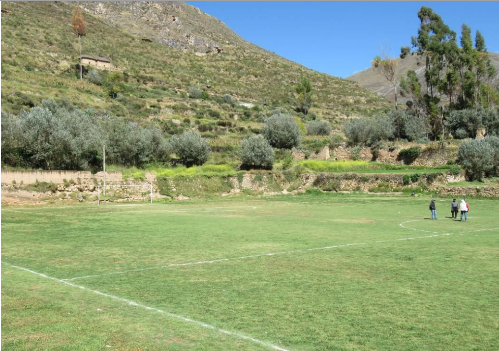
Foto Nº 1. Vista panorámica del área donde se encontraba la plaza del Complejo Arqueológico Monumental de Tarmatambo, ahora es ocupada por un campo deportivo.