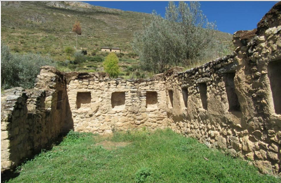
Foto N° 3. Destalle del interior de una estructura que contiene hornacinas, típicas construcciones del periodo incaico.