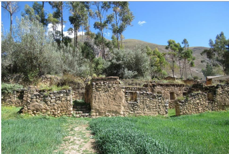
Foto Nº 2. Vista desde este a oeste de estructuras incaicas en la parte baja del BIP de Tarmatambo.