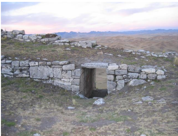
Vista de una de la portada Intipunku.

En la cima también se observa construcciones rectangulares que parecen corresponder a la ocupación Inca.