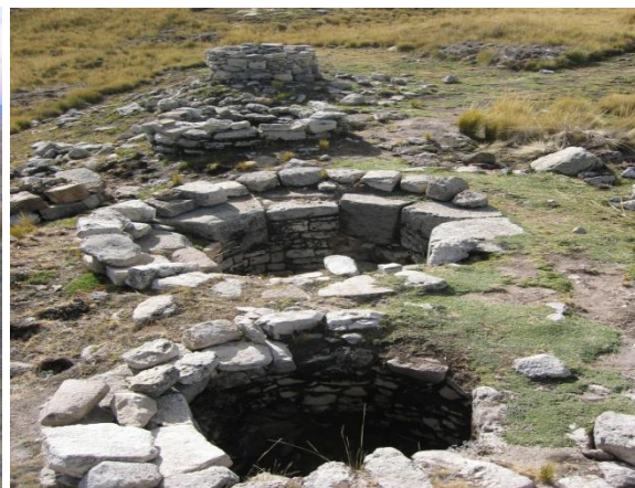
Vista de las estructuras funerarias del complejo arqueológico monumental Muyuqhawa.

Muyuqhawa es entonces un importante complejo arqueológico monumental dentro de la región de Cusco, cuya ubicación permitió controlar el entorno de la cuenca de río Salado,