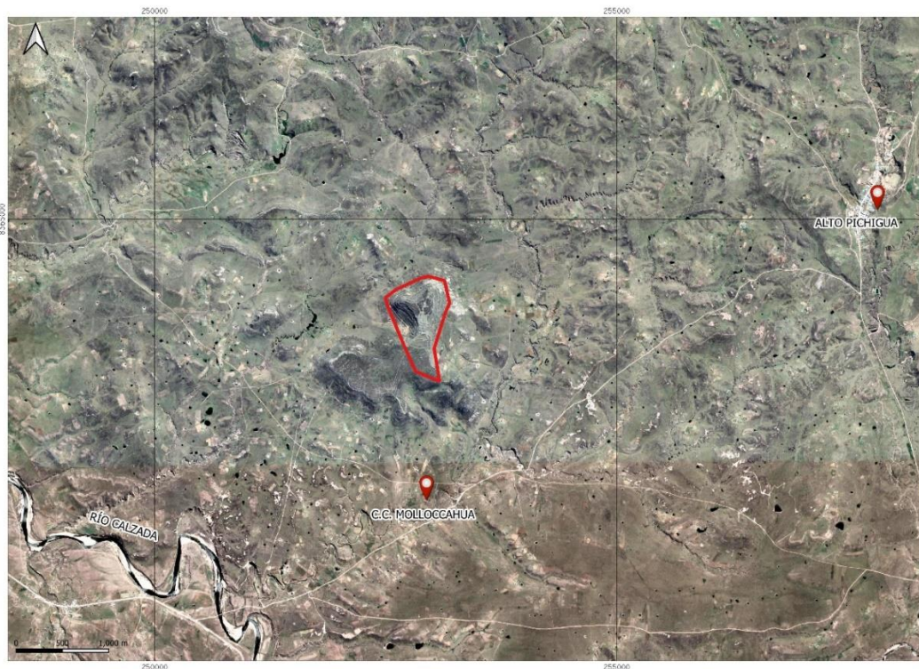
Ubicación del complejo arqueológico monumental Muyuqhawa