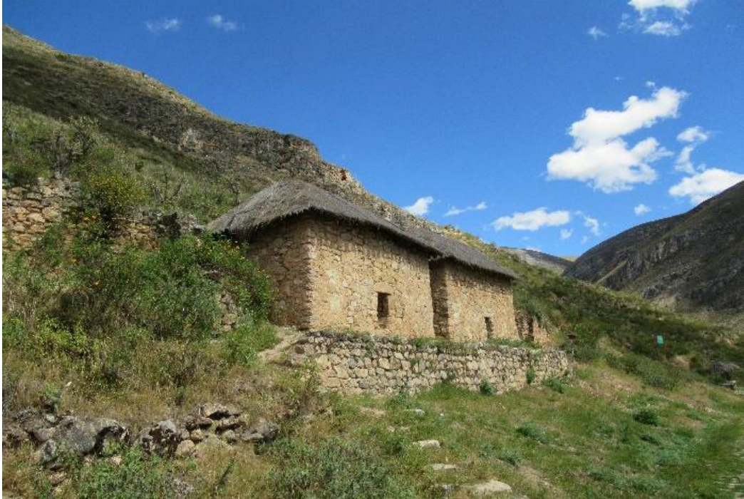
Detalle de colcas restauradas en el Complejo Arqueológico Monumental Tarmatambo

El informe de Craig Morris (1967:63) contiene referencias a la Kallanka, las Colcas y el Awana wasi, en cuya descripción se incluye la sala con 6 puertas, 10 nichos y 16 anillos de piedra utilizados como sostenedores. En 1995-96 todavía eran visibles las Kallancas, la plaza mayor, el Acllahuasi, las colcas, los centros poblados de producción de tejidos y algunas Kanchas residenciales. La plaza principal aparece inusualmente fuera del núcleo poblado porque era el único espacio potencialmente habitable para este propósito. La Kallanka fue edificada en el extremo Nor Oeste del barrio CuchucanCHA, mientras que el taller de producción de tejidos se construyó en el extremo Sur Oeste.