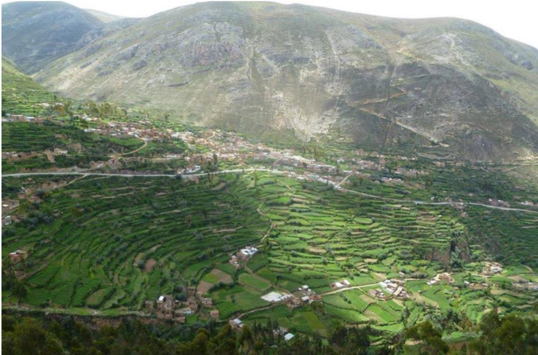
Sistema de andenería en el entorno paisajístico de Tarmatambo

El Complejo Arqueológico Monumental presenta un camino prehispánico, en algunas partes es escalonado, que conduce a los diferentes sectores que lo componen, en la parte alta están las terrazas amplias de cultivo, los muros de esta parte son pircados, en la parte norte existe una plaza cuadrangular, actualmente utilizada como campo deportivo. El material constructivo es la piedra.