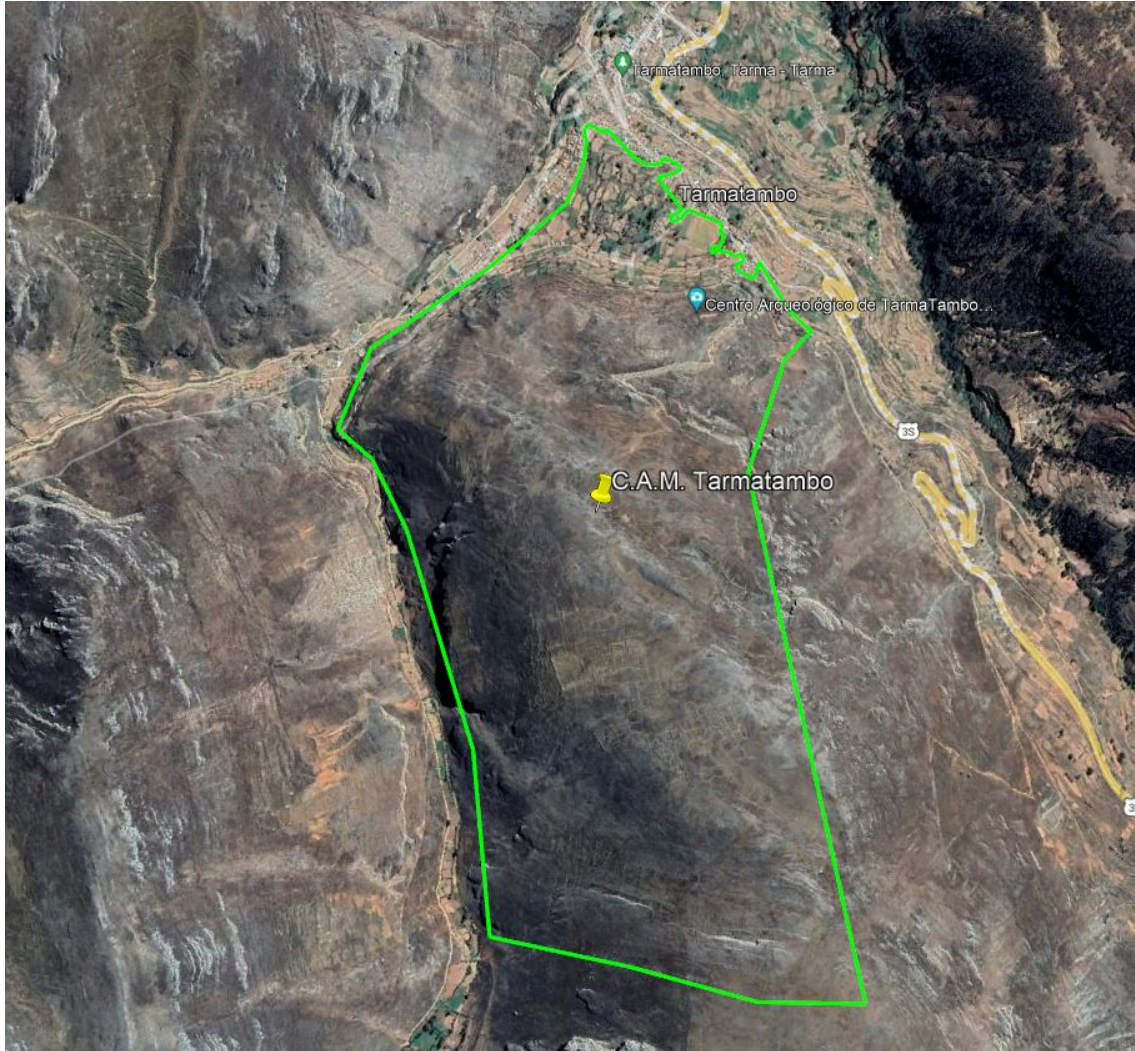
Vista satelital del polígono arqueológico del Complejo Arqueológico Monumental Tarmatambo

Se ubica en la Comunidad Campesina de Tarmatambo, en el distrito de Tarma, provincia de Tarma, departamento de Junín.