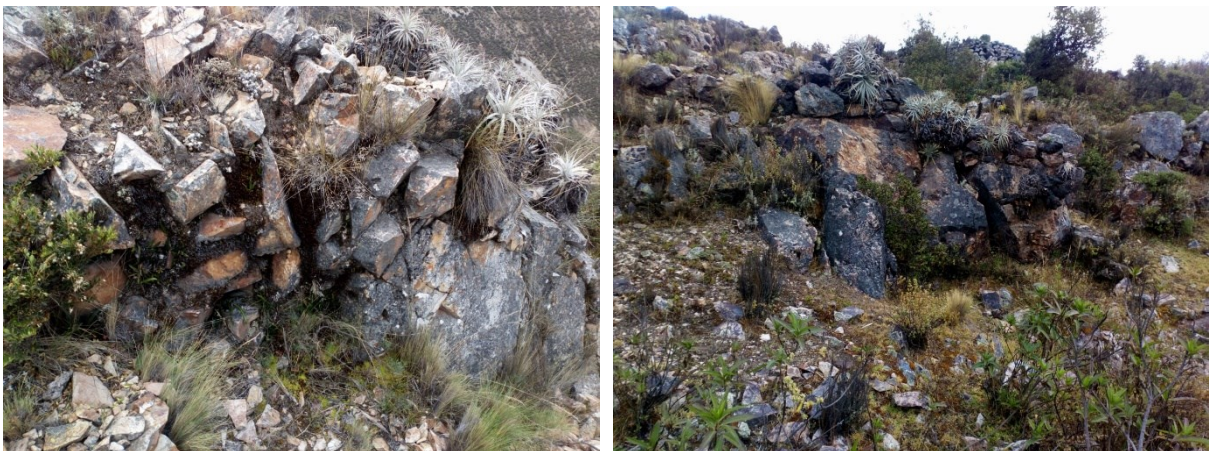
Fotografías de los muros de piedra canteada registrados en El Potrero.

La arquitectura del sitio, es similar a la encontrada en Wakakillayoc y Muyu Muyu, tanto en técnica, materiales constructivos y diseño, siendo probable que hayan sido construidas en la misma época.