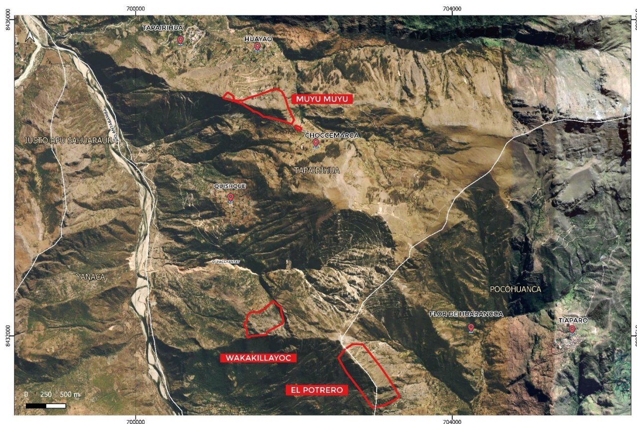
Ubicación de los MAP Muyu Muyu, Wakakillayoc y El Potrero.