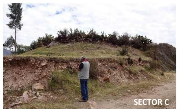
Fotografías de las estructuras de piedra identificadas en los tres sectores de Muyu Muyu.